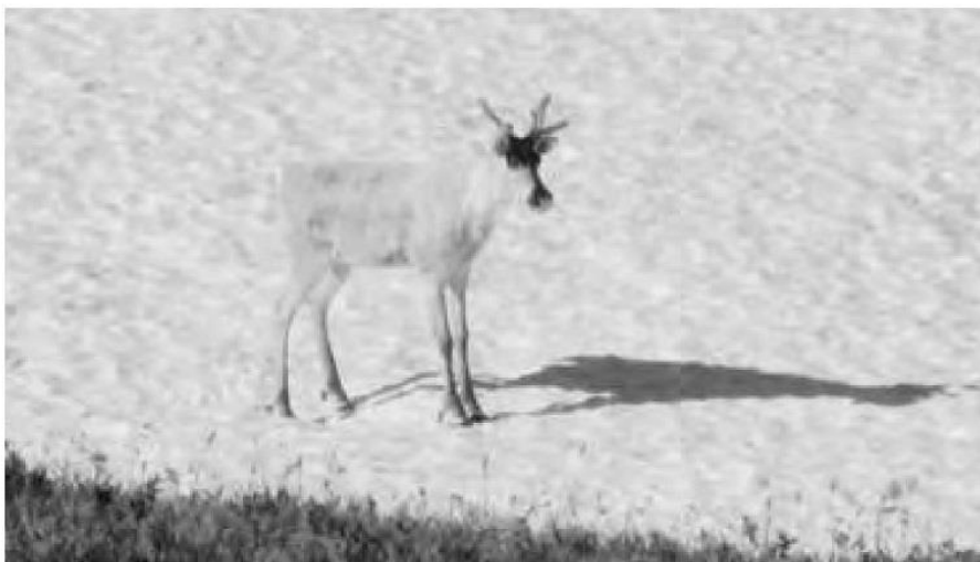
Рис. 3. Молодой олень на снежнике в верховьях р. Чульча, июнь 2015 г.

р. Чульча с целью изучения состояния группировки северного оленя, для регистрации животных установлены камеры наблюдения. В отличие от абаканского участка обитания оленя здесь обычны лишайниковые тундры, как в альпийском поясе, так и в субальпийском и таежном. Луговые же ассоциации встречаются реже, доминируют ерники лишайниковые и мшистые. Северный олень держится преимущественно выше 1700 м над у. м. Ранее по бассейну р. Чульча отмечали его и ниже (до 1300 м над у.м.) [5]. Последний раз лежки отдыхающего стада оленей на снегу были встречены в июле 2016 г., в июне 2015 г. встречена группа из 3 оленей [6], а в октябре 2012 г. сфотографирована с вертолета гонная группа из 27 животных. Для ведения мониторинга вида в чульчинском очаге обитания необходимо тщательнее обследовать территорию, выделить ключевые участки обитания, установить достаточное количество камер наблюдения.