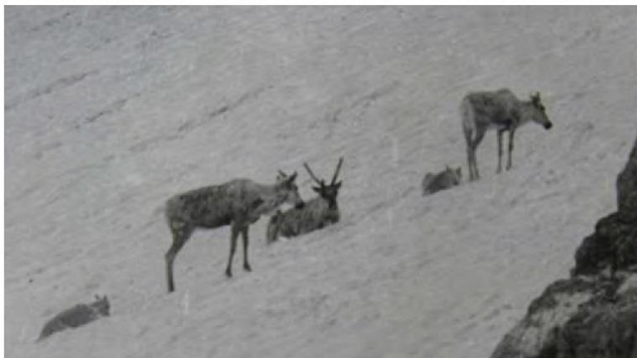
Рис. 2. Группа северных оленей, отдыхающих на снежнике в окрестностях г. Косбажи Абаканского хребта. 1982 г.

Северо-Шапшальский очаг обитания оленя расположен на территории Алтайского заповедника и участка «Кара-Холь» заповедника «Убсунурская котловина». Со стороны Алтая сюда идут только конные тропы, и путь от населенных пунктов занимает от 5 до 8 дней, район труднодоступен. В то же время со стороны Тывы, от районного центра (с. Кара-Холь), до мест обитания оленя можно добраться за 1,5 дня. Через существующий сейчас очаг обитания оленя проходит древняя тропа из Тывы в Хакасию на целебный источник. Судя по останкам на станах вдоль тропы, наличию засидок на проходных тропах и перевалах, жители Тывы во время переходов активно охотятся на копытных, в том числе, и на северного оленя. Его останки разной давности присутствуют на местах отдыха охотников. На перевале, через который преимущественно заходят жители Тывы для незаконной охоты на соболя зимой расположено пастбище оленя, где в прошедшем году один из нарушителей заповедного режима видел около 80 животных. И, тем не менее, этот вид здесь не истреблен. Последние 2 года сотрудники Алтайского заповедника посещают верховья