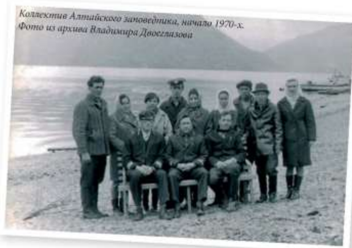
Коллектив Алтайского заповедника, начало 1970-х.

Лишь с начала работы «третьего» Алтайского заповедника его научный отдел стал выпускать Летопись природы, похожую на современную. Компьютеров тогда не было, и книга летописи выглядела просто. В 1970-х годах летопись получила официальный статус. За заповедниками ЦНИЛ Главохоты РСФСР, в ведении которой находился тогда и Алтайский заповедник, была закреплена обязательная тема № 1 «Наблюдение процессов и явлений в природном комплексе заповедника и их изучение». Ежегодные отчеты по этой теме стали называть Летописью природы.