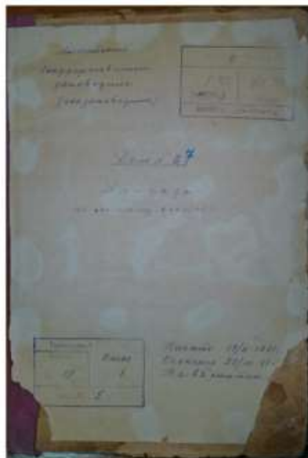
Книга приклатов по личному составу за 1941 год.