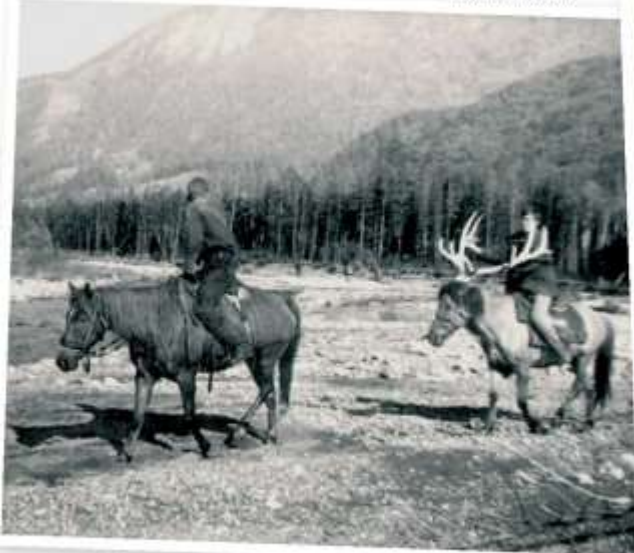
У переправы через Шавлу. 19.08.1972.