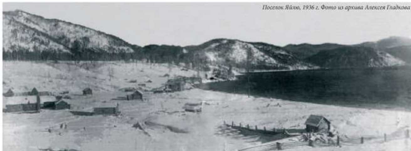
Поселок Яйлю, 1936 г.

В 2017 году исполняется 85 лет Алтайскому государственному заповеднику. Много событий произошло за эти годы, и по прошествии времени интересно узнать, как все начиналось, кто стоял у истоков одного из старейших заповедников России, как жили заповедные люди в те далекие годы прошлого столетия.