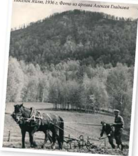
Поселок Яйло, 1936 г.