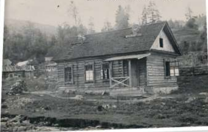
Общественная баня, построенная в 1937 году в Яйло для сотрудников заповедника.