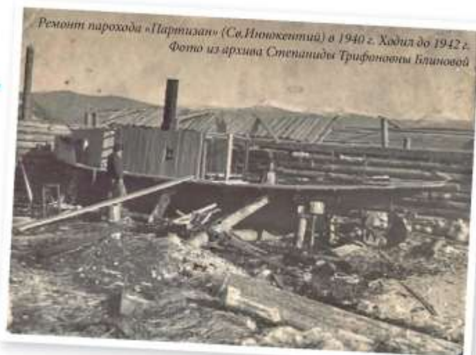
Ремонт парохода «Партизан» (Св.Николаевский) в 1940 г. Ходил до 1942 г.