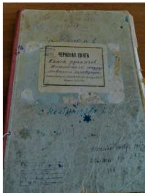
Книга приклатов по личному составу за 1937 год.