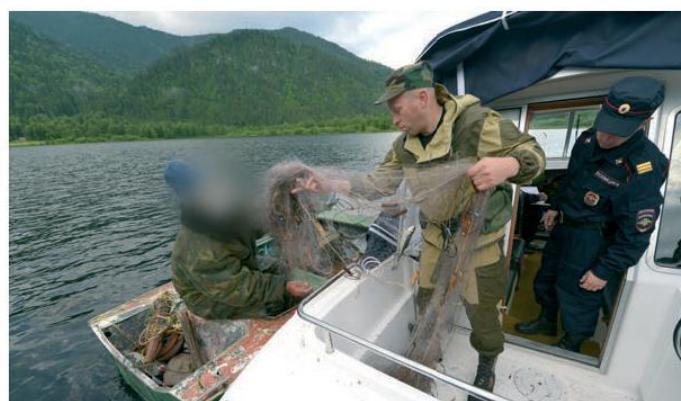
Задержание за незаконную рыбалку — рейд совместно с транспортной полицией.

Находясь на озере, инспектора совершают радиальные выходы, патрулируют и исследуют местность в округе. Здесь фиксируется большая часть нарушений, связанных с незаконным нахождением и рыбалкой на заповедной территории.