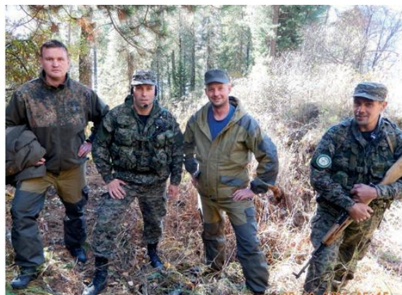
В 2015 году для обмена опытом в Алтайский заповедник приезжали госинспекторы нацпарка Онежское поморье

Положительные результаты дает и взаимодействие с пограничной службой, которая оказывает заповеднику помощь в мониторинге популяции снежного барса, а экспедиции, проходящие в приграничных районах, сообщают пограничникам о выявленных нарушениях пограничного режима. Со своей стороны, пограничники содействуют работе таких экспедиций, помогая с установкой и обслуживанием фотокамер.