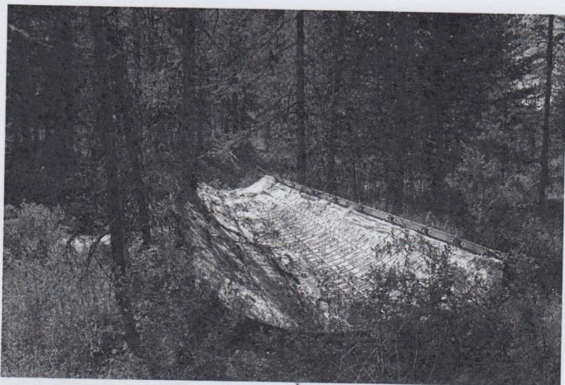
Рис. 1. 51.28282 088.57831 река Подай