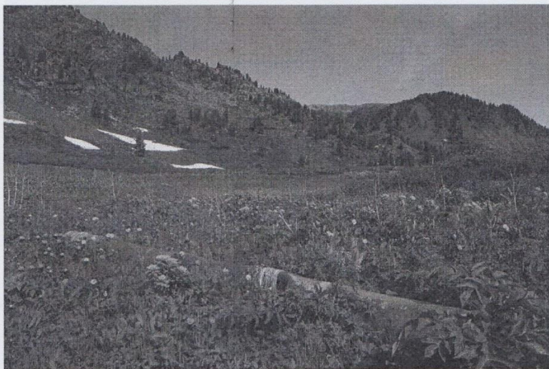
Рис. 4. 51.35431 088.18141 район реки Косбажи