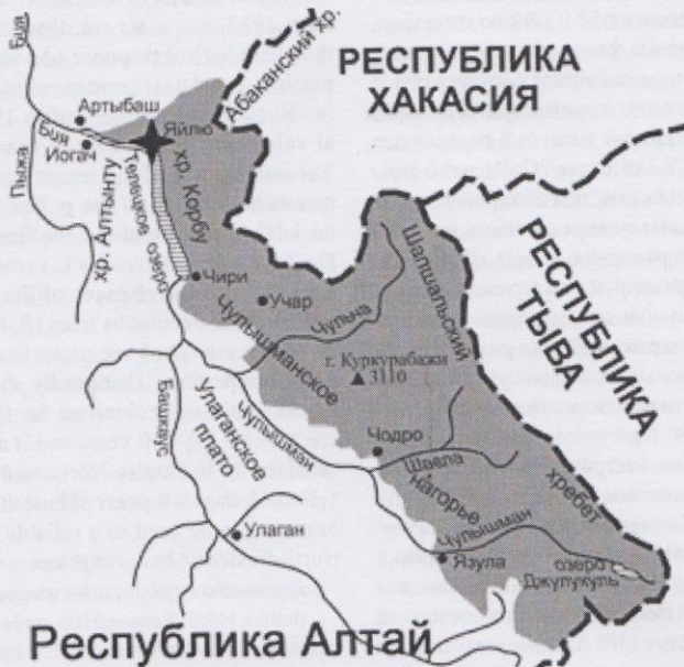
Рис. 1. Карта-схема района исследований с выделением территории Алтайского государственного природного биосферного заповедника

Алтайский государственный природный биосферный заповедник общей площадью 871206,6 га (в том числе площадь Телецкого озера — 11410 га), расположенный в азиатской части России, был основан 16 апреля 1932 г. (рис. 1). Это уникальнейшая особоохраняемая природно-биосферная территория, объект Всемирного культурного и природного наследия ЮНЕСКО, входящий в список «Global-200» (WWF) — девственных или мало измененных экорегионов мира, в которых сосредоточено 90% биоразнообразия планеты, при этом занимающий одно из первых мест среди российских заповедников по биологическому разнообразию [11].