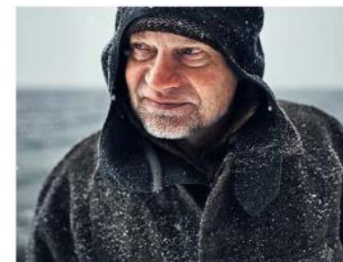
Кадр из документального фильма «Хранители Алтая», реж. Д. Безденежных, 2018 г.

табу – это мудрые вещи, нарушая которые ты можешь нарушить эту гармонию. А что из этого выйдет – часто никто не знает. Как говорится, потом не удивляйся.