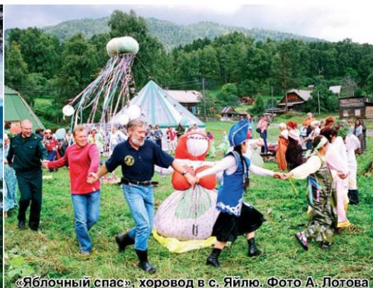
«Яблочный спас»: хоровод в с. Яйло.