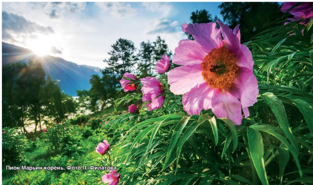
Пион Марьин корень.

Стоит отметить, что понятие «Алтайская биосферная территория» имеет широкие границы. Она включает в себя непосредственно заповедное «ядро» (Алтайский