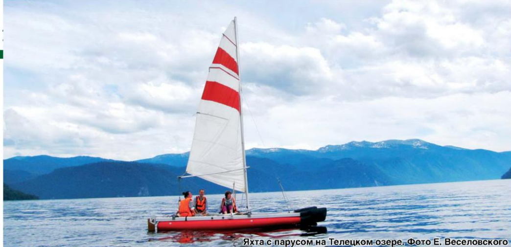
Яхта с парусом на Телецком озере.