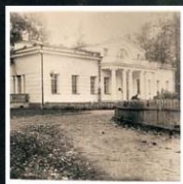
Холопий городок на Мологе-реке