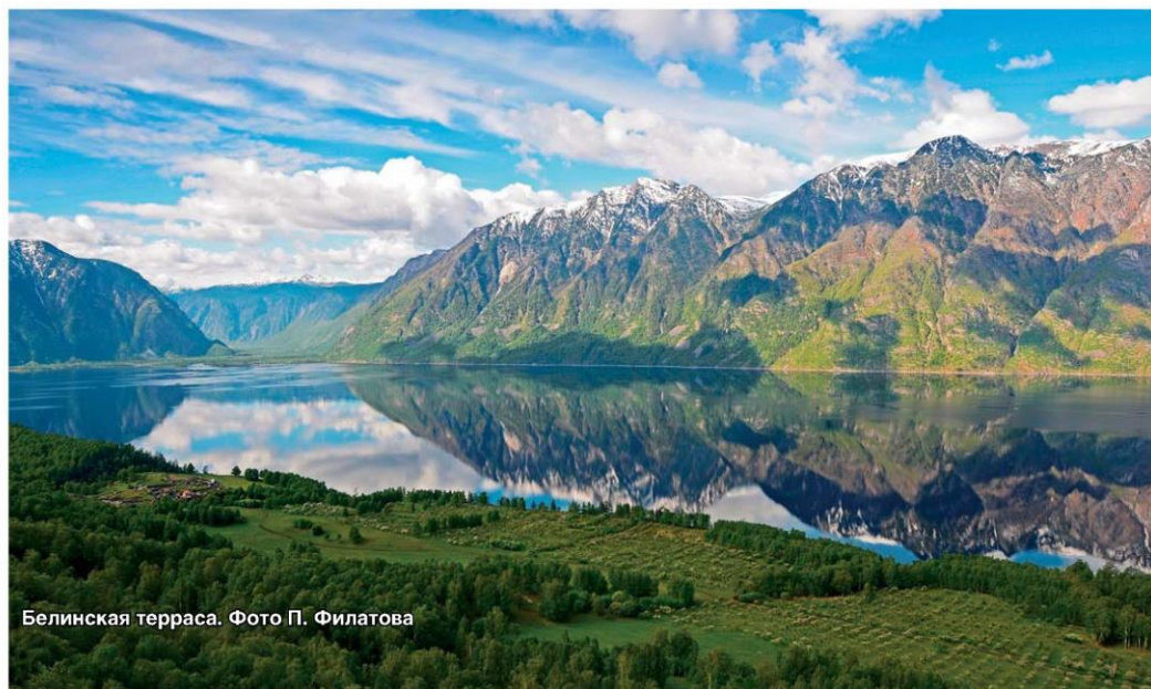
Белинская терраса.

Благодаря биосферному заповеднику местные жители имеют возможность дополнительного заработка посредством предоставления услуг сельского и экологического