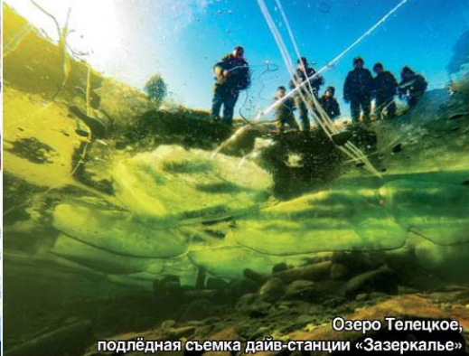
Озеро Телецкое, подлёдная съемка дайв-станции «Зеркальце»

фитобентоса, оценивают состояние акватории озера и проводят дайв-рейды по очистке озера от мусора и браконьерских сетей. Во время рейдов вместе с сотрудниками охраны Алтайского заповедника снимают и поднимают на поверхность старые рыболовные сети. Такие сети, даже будучи брошенными и забытыми, продолжают годами убивать фауну озера в огромных количествах и наносить непоправимый вред экосистеме.