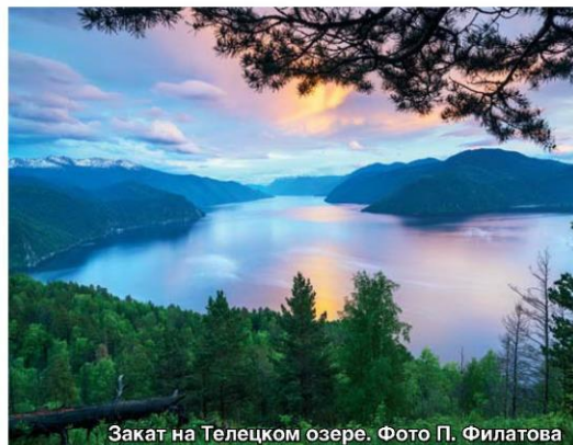
Закат на Телецком озере.

Дайверы оказывают большую помощь в исследовании подводного мира Телецкого озера, малоизученного зоо- и