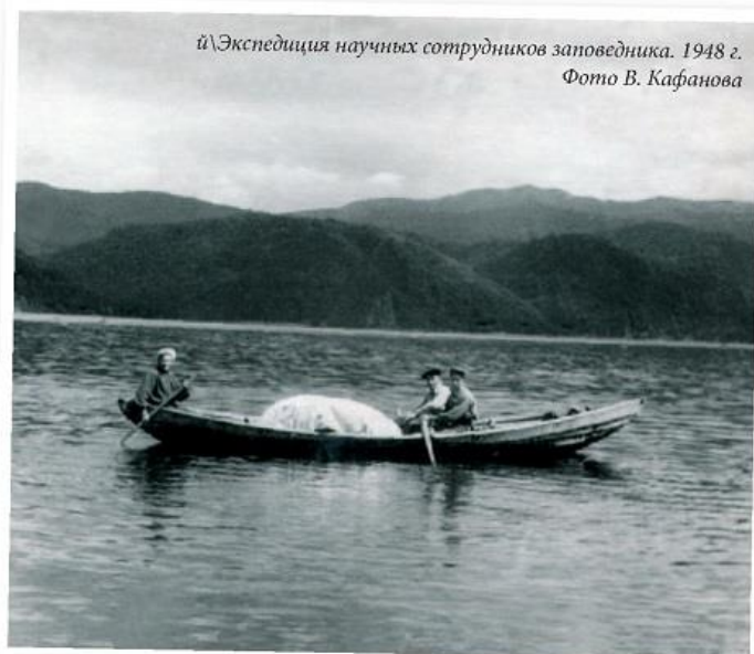
Экспедиция научных сотрудников заповедника. 1948 г.