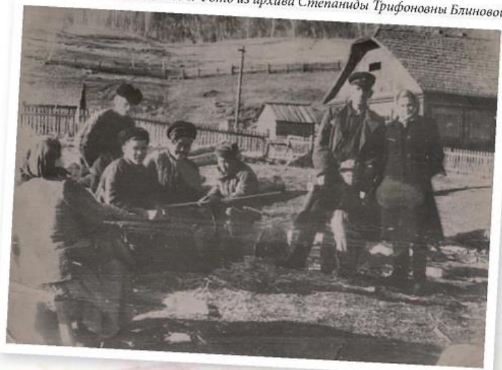
Сельскохозяйственные работы на Беле, 1966 год.