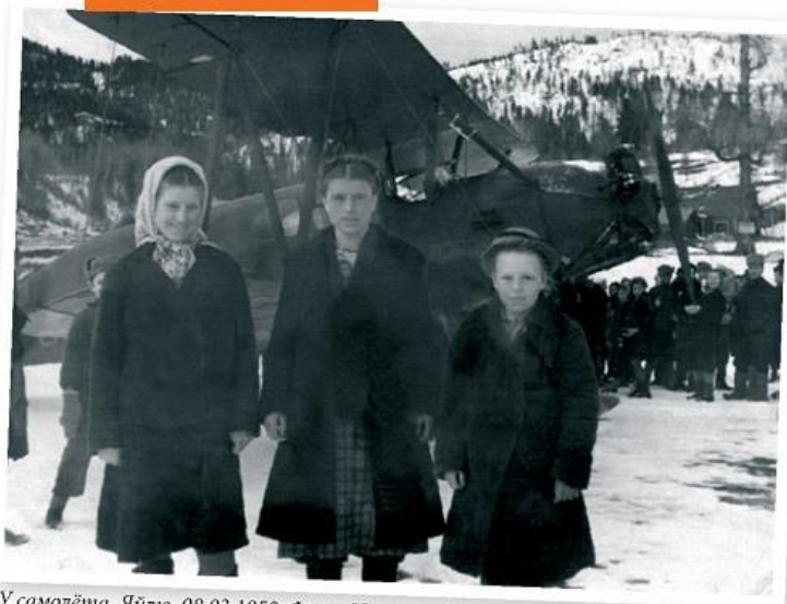
У самолёта. Яйлю, 08.03.1950.