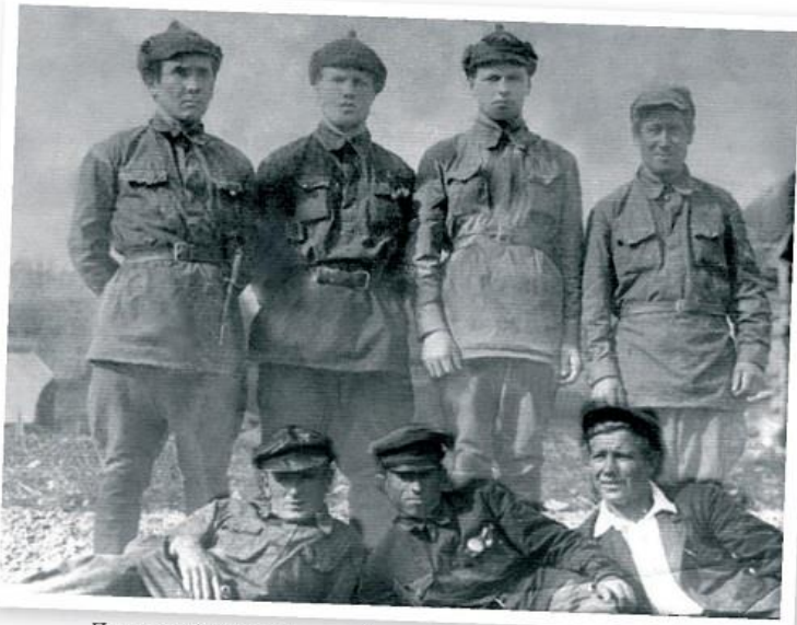
Первые наблюдатели заповедника. Яйлю, 1937

валиться, шел по ледяному полю, стараясь приблизиться к карбасу. И так же, как весной, приходилось женщинам таскать кули с зерном на плечах, разгружая карбас и вытаскивая на себе груз до того места, где ожидал обоз».