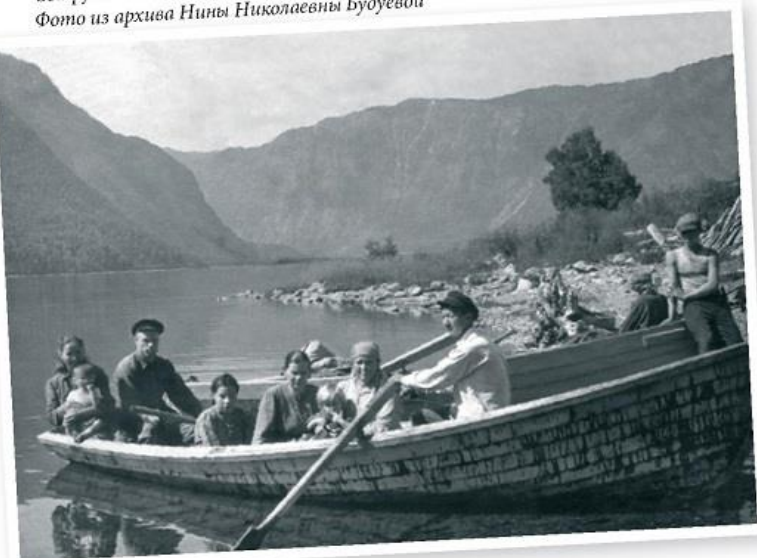
Сотрудники Алтайского заповедника и члены их семей на лодке в Чирях, 1946 год.

работали по восемнадцать — двадцать часов в сутки. День и ночь стучала молотилка, зерно после обмола та ссыпали в мешки, взвешивали, подводами возили на берег. Зимой до двух десятков саней, нагруженных пшеницей, отправлялись за триста километров, в город. За сезон завезти муку на отдаленные кордоны полностью не успели. С наступлением холодов зерно молили только в центральной усадьбе. У мельничного колеса день и ночь горели костры, шла упорная борьба с морозом.