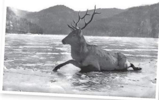
Марал, упавший на скользком льду. Яйлю, 1969 год.

непрочному льду проходило по грани жизни и смерти. Но и женщины, и подростки смело шли на риск, считая своим долгом отдать все силы ради общей победы. Большинство грузов перевозили на карбасе, который двигался, по словам Малышева, с «черепашьей скоростью четыре километра в час» при тихой погоде. На такое судно можно было погрузить несколько тонн груза, лошадей, свиней и коров, а также перевезти большую группу людей. На веслах сидели девушки — «по две за веслом» , а когда начинался верховой или низовой ветер, карбас летел по волнам почти без помощи людей.