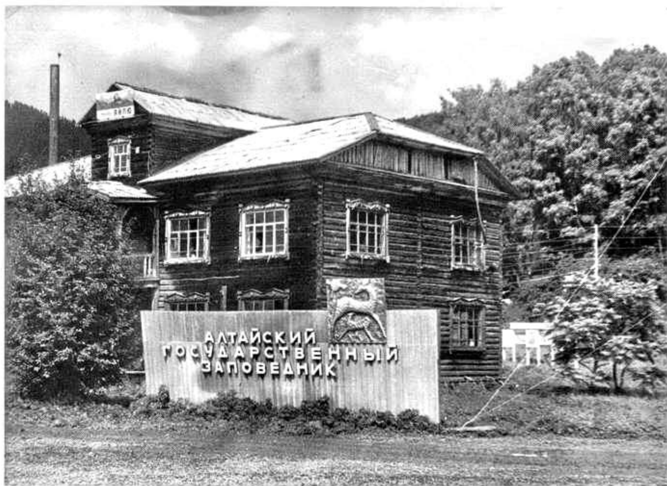
27. Без малого 65 лет это здание олицетворяло собою заповедник и поселок Яйлю. 22 декабря 1999г. оно сгорело, предопределив наступление эпохи нового "четвертого" заповедника (фото 1975г).