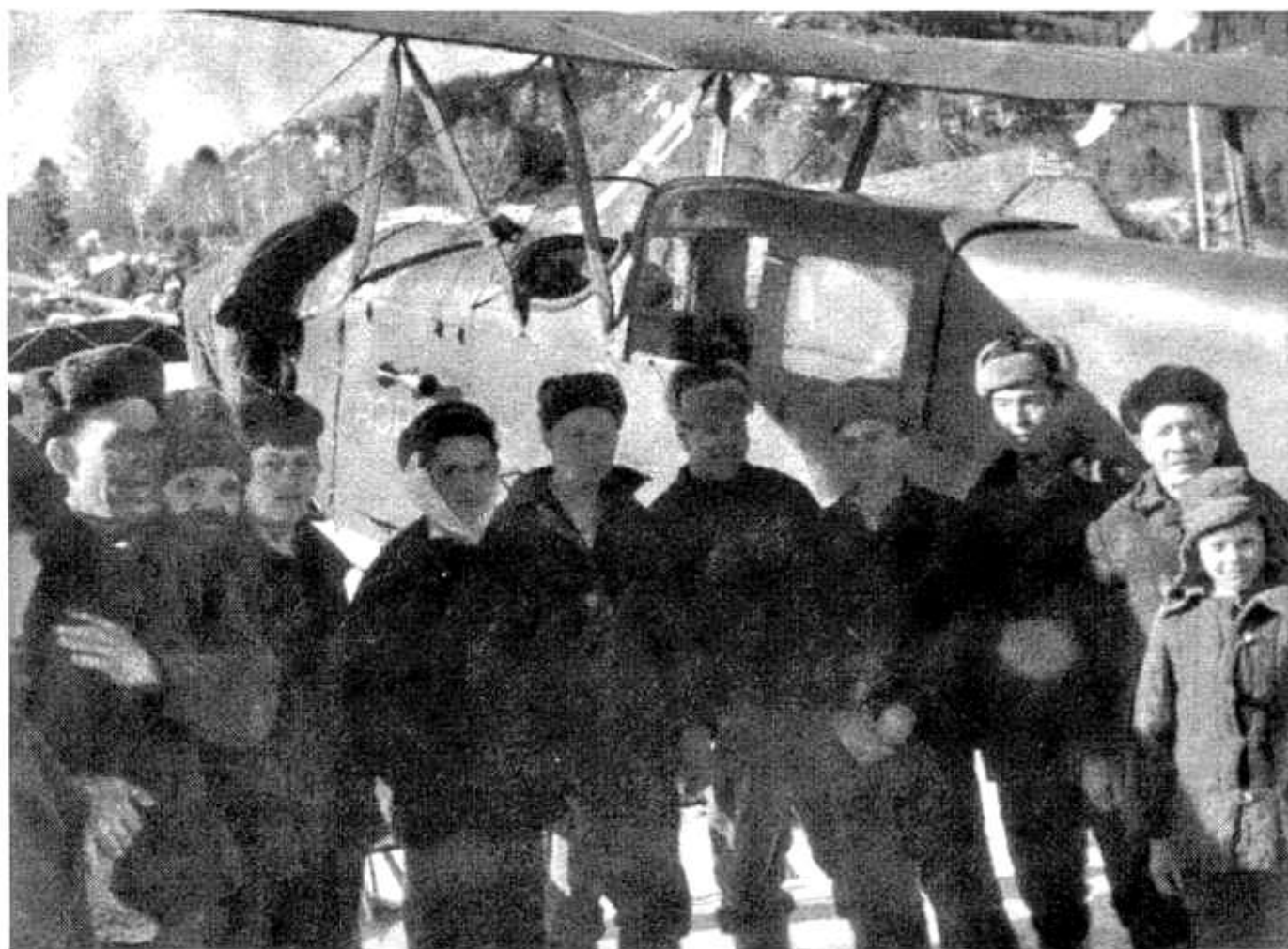
35. В конце 40-х гг. на лед озера совершали посадки "чартерные" рейсы с "Большой земли". пос. Яйлю.