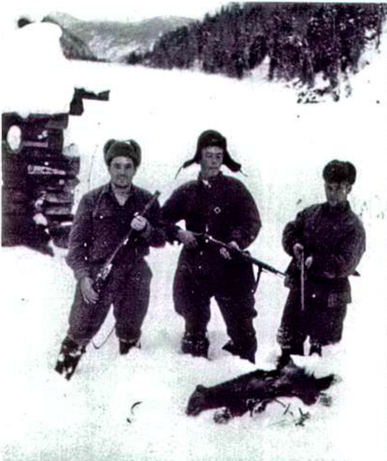
33. Зима 1948г. Камгинский залив. Около пойманной в капкан росахахи.