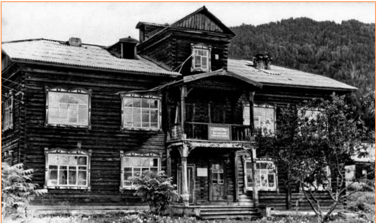
Контора Алтайского заповедника. Яйлю, 1970 г.

Главной достопримечательностью и, на мой взгляд, украшением посёлка была контора Алтайского заповедника, которая стояла, практически, на берегу озера. Я до сих пор помню её запах – запах дерева, лака и бумаги – трудов научных сотрудников. Контору можно было считать местным небоскрёбом – двухэтажное деревянное здание, в котором располагались кабинеты директора заповедника, научных сотрудников, бухгалтерия.