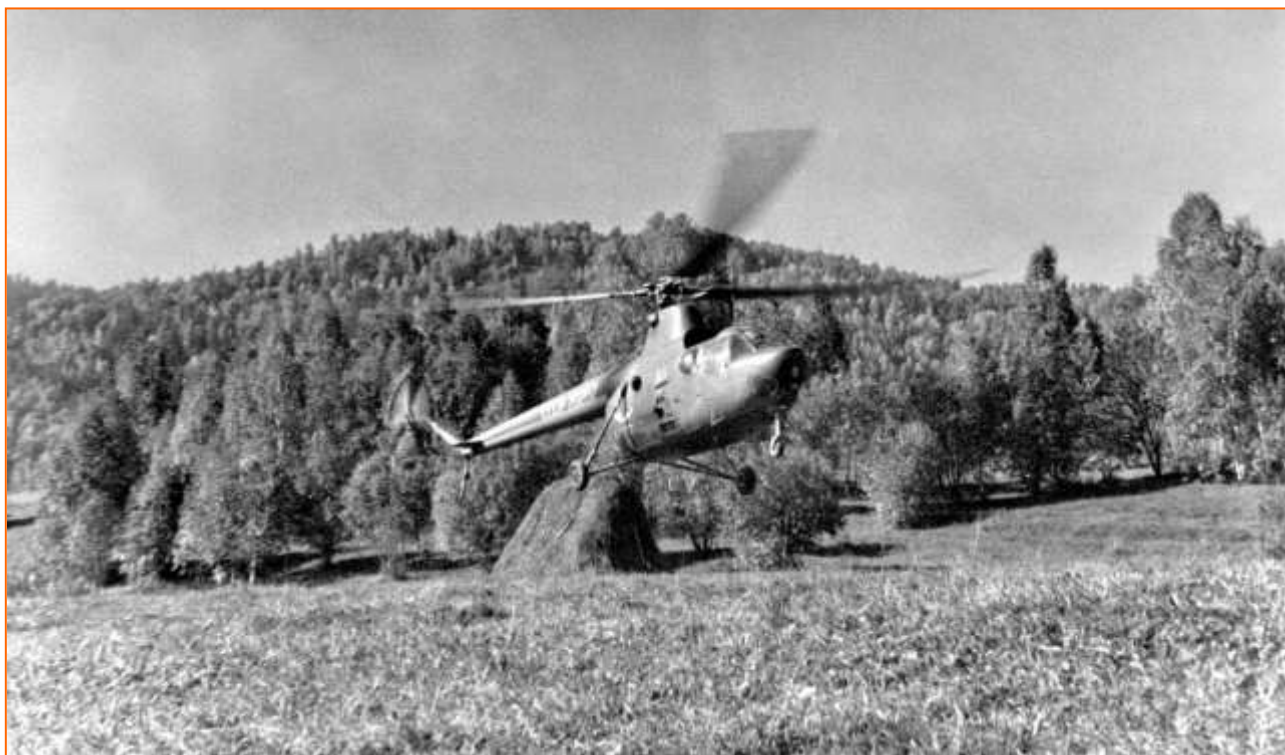
Ура! Почта прилетела.

А ещё помню, как в посёлке все ждали прилёт вертолета. Да-да. Почтовый вертолёт МИ-2 прилетал в посёлок почти каждый день, если позволяла погода.