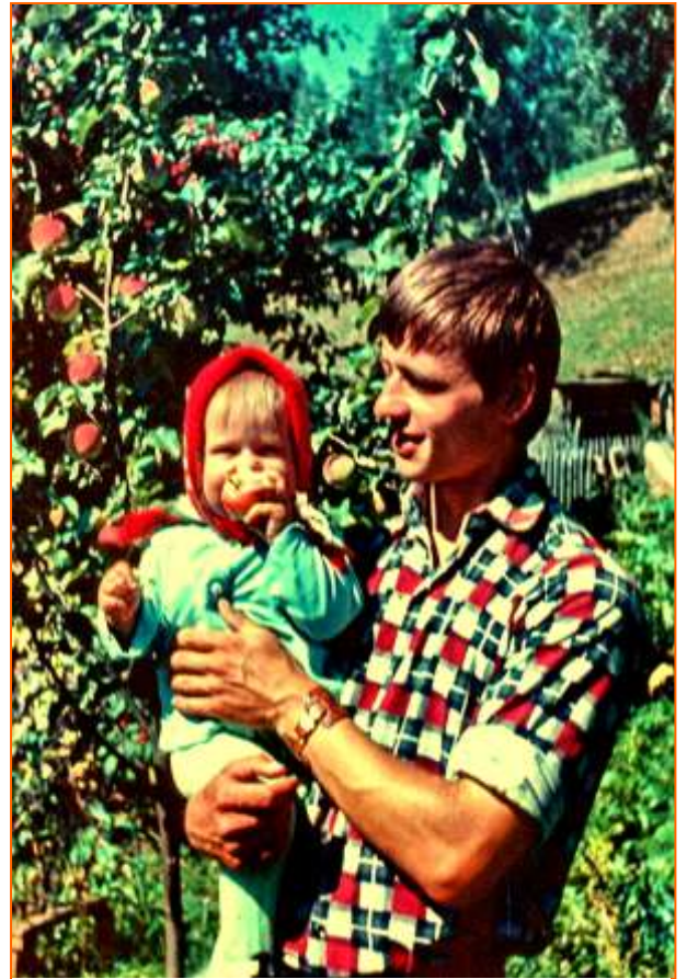
С папой в садочке