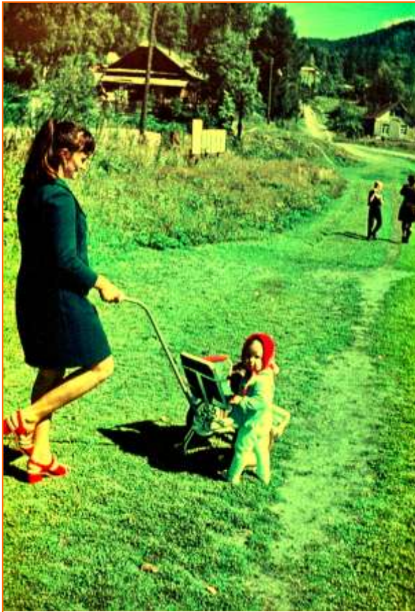
С мамой на зелёной травке