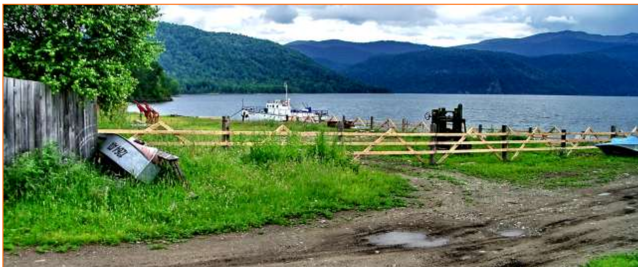
От хоздвора осталась только пыльная рама. Яйлю, 2016 г.

На пилораме пилили брёвна, распуская их на доски для нужд заповедника, а в столярке у нас пару раз проходили труды. Помню одной из поделок на трудах стал деревянный молоток для отбивания мяса.