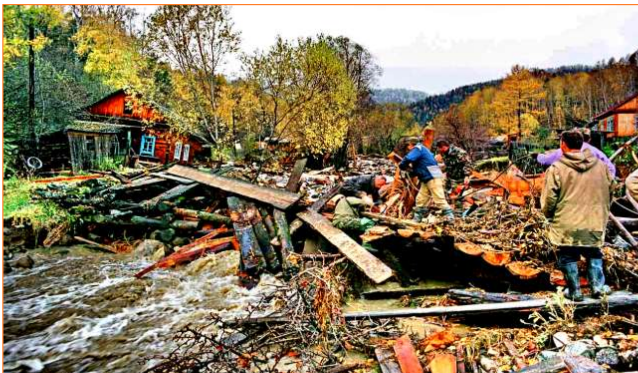
В 1999 году наводнением подмыло яйлинскую пекарню.

Сейчас хлеб в Яйлю привозной, привозят или заказывают с оказией каждый себе. Кто-то ещё печёт свой дома, но таких не много. А что с пекарней? Её тоже нет... После наводнения, повредившего здание в 1999 году, восстанавливать пекарню не стали. Работать некому, платить нечем.