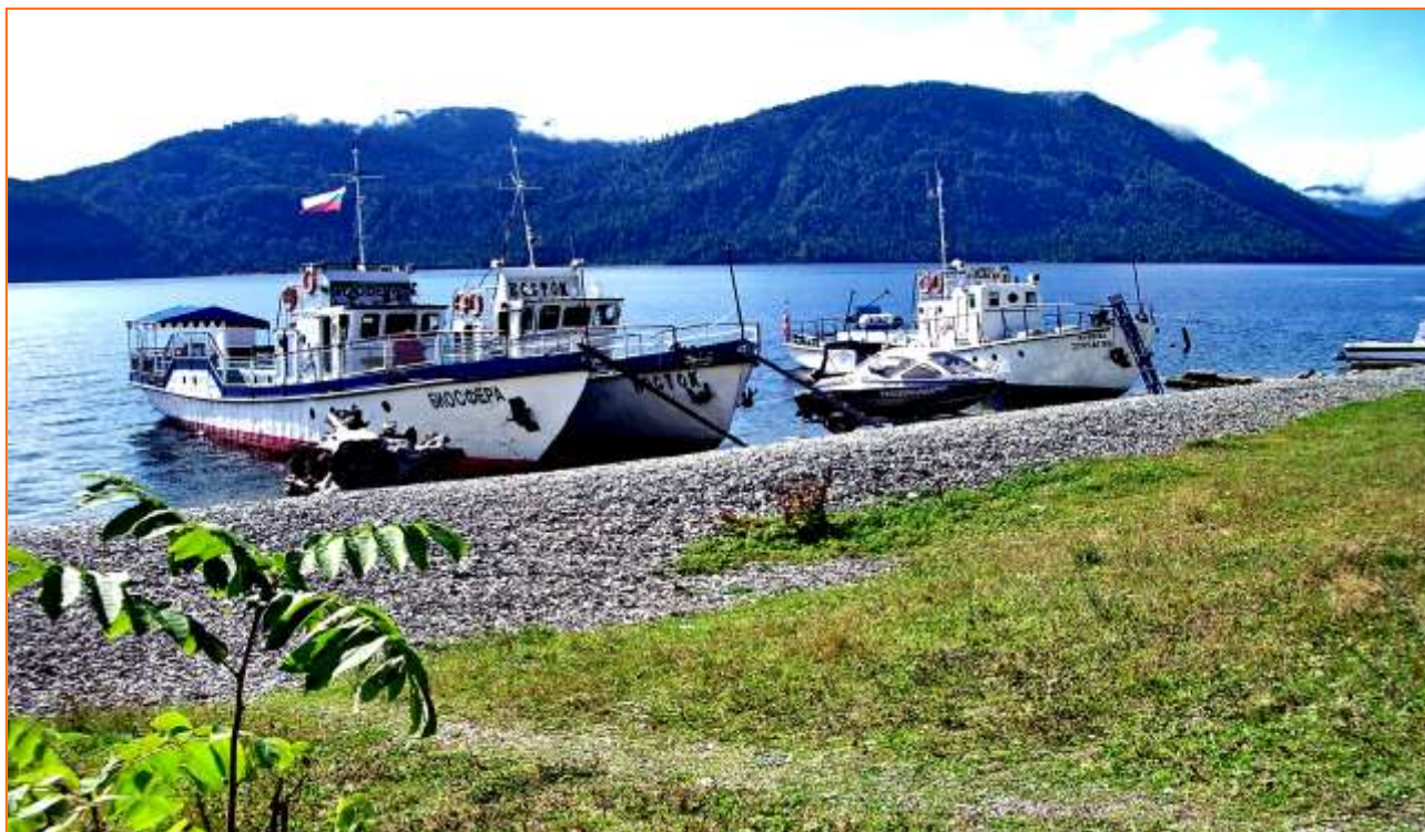
Катера у Яйлинского берега, 03.09.2018.

Не сохранилась и дамба, а также пилорама со столярной мастерской. Дамба служила причалом для катеров метеостанции и заповедника и защищала эти небольшие суда от волн Телецкого озера в штормовую погоду. Метео-