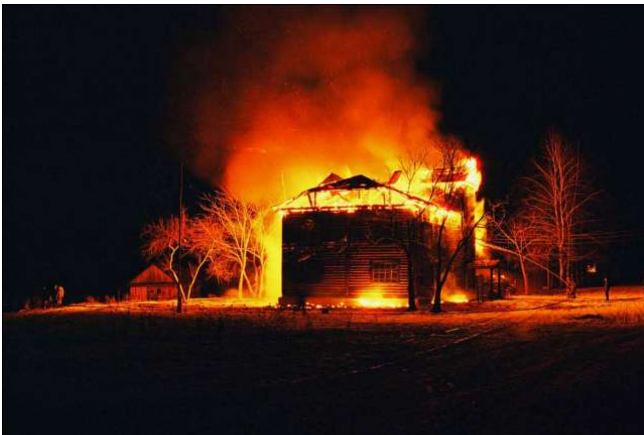
Горит контора Алтайского заповедника. Яйлю, 21.12.1999.

А ещё помню, как в посёлке все ждали прилёт вертолета. Да-да. Почтовый вертолёт МИ-2 прилетал в посёлок почти каждый день, если позволяла погода.