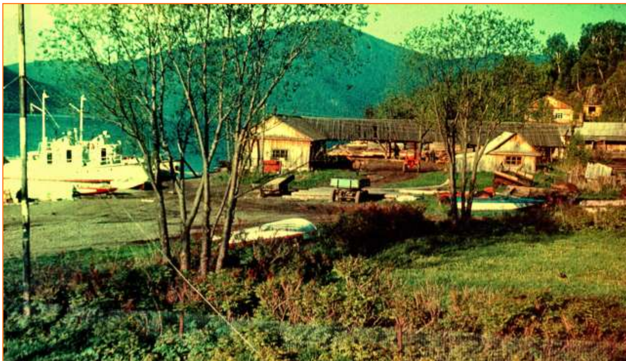
Яйлинский хоздвор с пилорамой и столяркой, 1987 г.

станция на своём теплоходе проводила исследования и наблюдения за озером, а заповедник на своём снабжал всем необходимым сотрудников, проживающих на прибрежных кордонах. На этих судах тоже можно было выбраться из посёлка на большую землю. В памяти остались такие названия теплоходов как Ирбис, Восток, Биосфера; теперь это Зурбаган, Мираж.