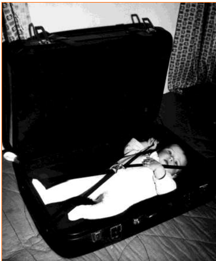
Когда-то я была вполне транспортабельной. Яйлю, 16.05.1974 г.