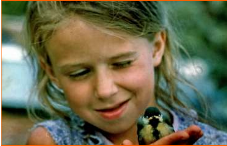
Птичка синичка.

Зимой, находясь дома, я слышала иногда звук бензопилы, распиливающей на чурки берёзовые стволы, и, хотя это может показаться странным, но мне нравился этот звук. А какой запах у свежеспиленной древесины! А как пели и поют в посёлке петухи! А ещё мне нравилось и нравится слушать шум прибора Телецкого озера и весеннее пение птиц! И хотя сейчас я живу за тысячи километров