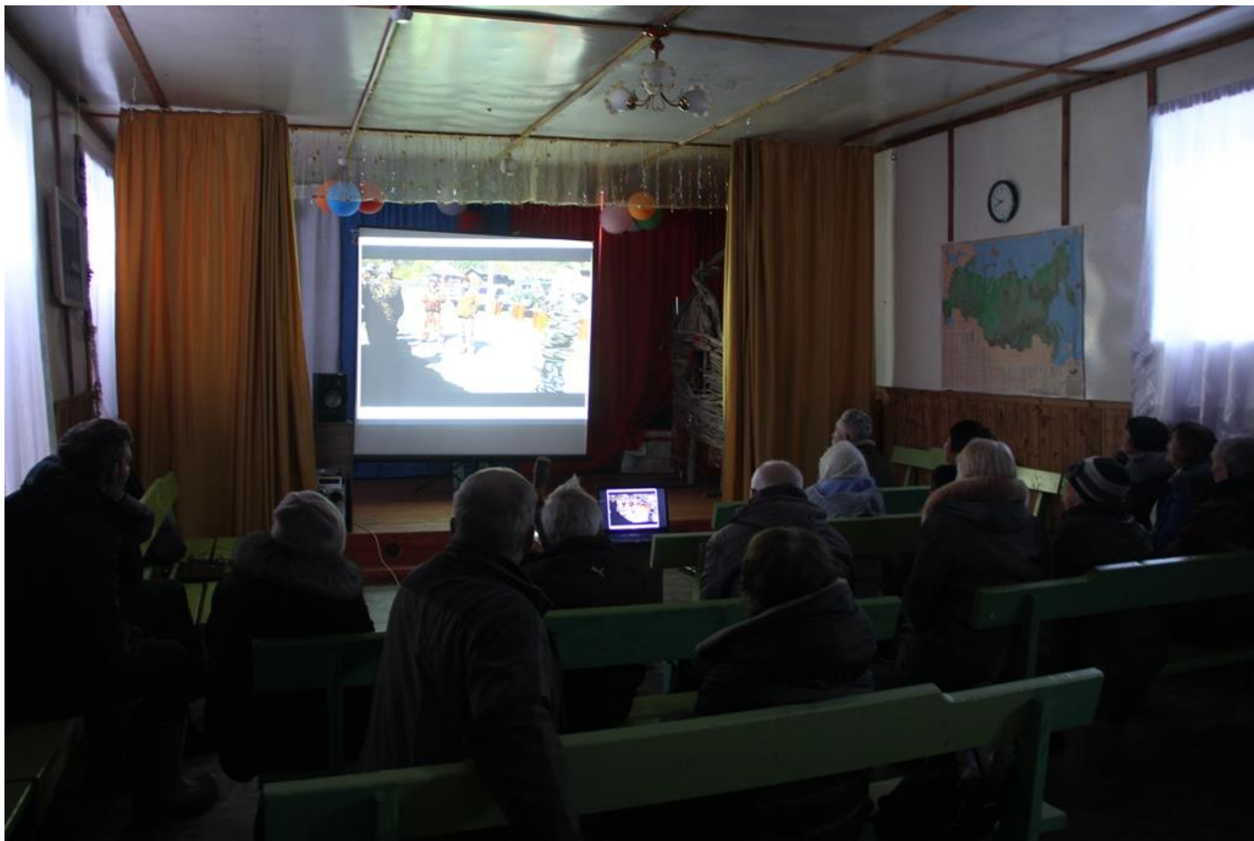
В клубе Яйлю 14.02.2020г.

большим интересом наблюдали самих себя на экране. В клубе стояла благодарная тишина.