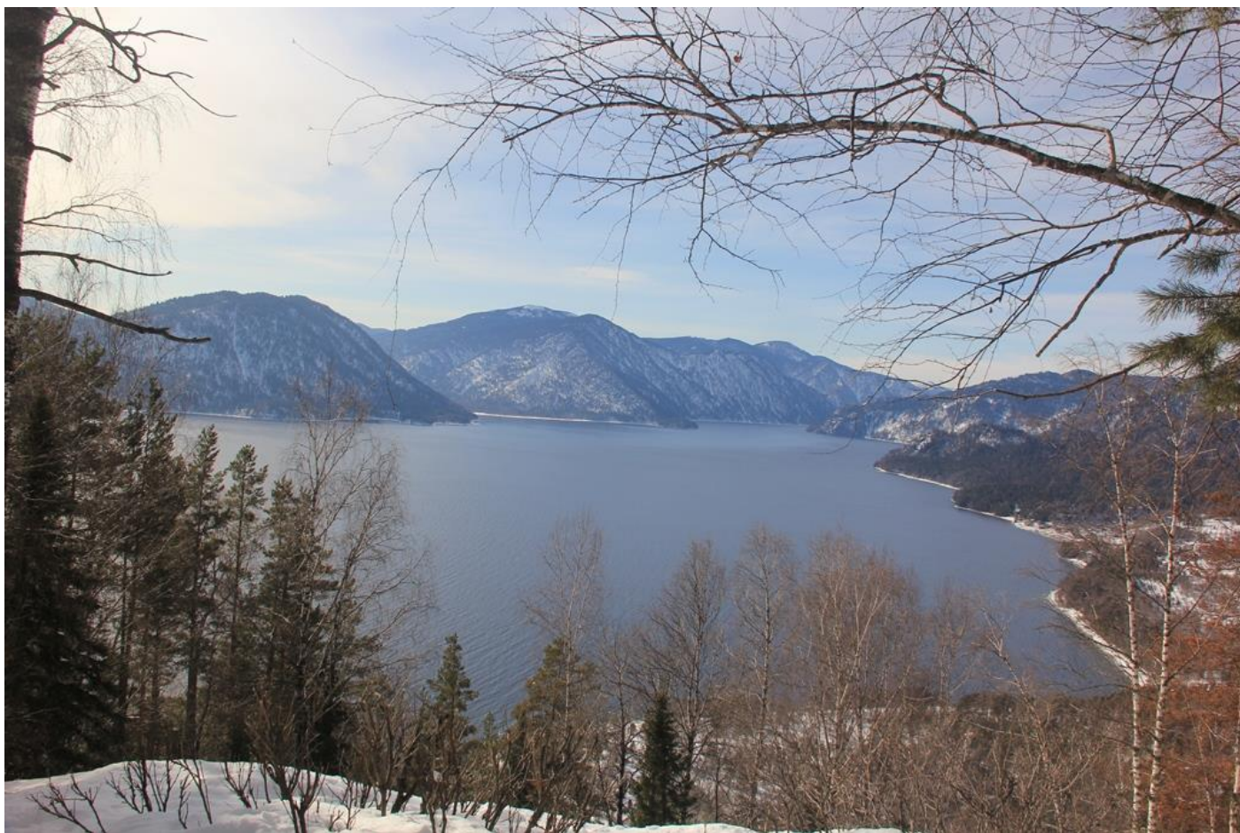
Вид на Яйлю с горы Чачилган.