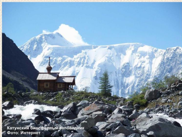
Катунский биосферный заповедник

В последние несколько лет мы ведём активную работу по дополнению номинации объектами культурного наследия, в первую очередь, речь идет о богатейших памятниках археологии, явлениях духовного наследия, которые имеют и трансграничное значение. От имени Алтайского отделения Российской Комиссии по делам ЮНЕСКО поздравляю население Республики Алтай, к которым номинация ЮНЕСКО имеет прямое отношение, и всех тех, кто ежедневно трудится на ее сохранение и развитие, сотрудников Алтайского биосферного заповедника, Катунского биосферного заповедника, природных парков: «Белуха», «Укок» и многих других, кому дорога красота золотых гор Алтая.»