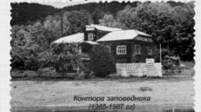
Контрора заповедника (1935-1987 год)