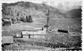
село Яблово, 1937 г.

В целях восстановления утраченных лесонасаждений, вырубленных вблизи кордонов на нужды сотрудников, а также для сохранения природной красоты, а также в целях обеспечения возможностей образования вокруг жилых поселений заповедника в дальнейшем садово-паркового хозяйства, запрещено проводить какую бы не было рубку деревьев и кустарников в радиусе одного километра вокруг каждого из жилых поселений заповедника. Лица, замеченные в нарушениях, должны будут возместить стоимость причиненного материального ущерба, а также стоимость работ по восстановлению древесных насаждений путём культурной посадки.