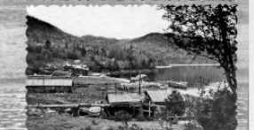
Яблово, завод / Бани, начало 1960-х