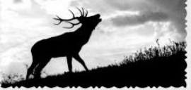
Фотография из архива Н.Н. Будовой, 30-40-е годы.