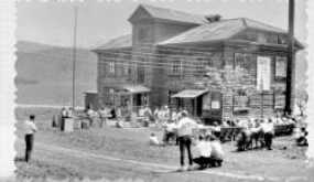
Контрора. Яблово, 15.06.1975