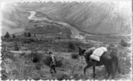
Культурный спуск. 1983 год.

Приказ № 172 от 30.11.1937г. Командировать зав.огородом т. Рачина Д.С. в Челушкет для получения на месте посадочного материала обливки для посадки в питомник Алтайского государственного заповедника.