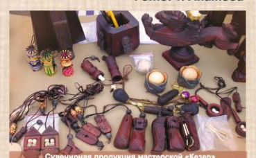
Сувенирная продукция мастерской «Кезер»