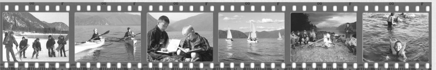
«И стебелек травы достоин великого мира, в котором он растёт». Рабиндранат Тагор